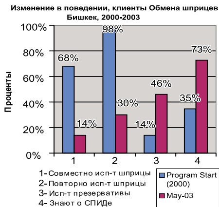
Рисунок 1: Изменение поведения, клиенты Обмена шприцев, Бишкек 2000-2003