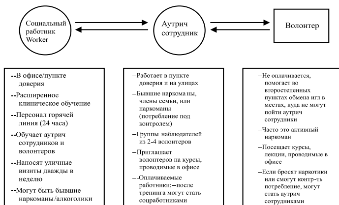
Рисунок 2: НПО «Социум»: увеличение возможностей для участия наркозависимых лиц